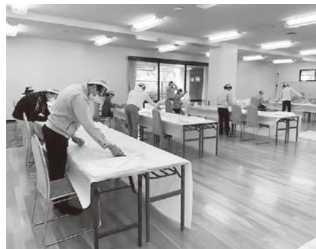
↑ 医療用防護ガウンの生産風景

医療従事者とコロナ患者の命を守る使命感と社会貢献意識の高さに加え、組合執行部と組合員が一致団結して、事業を遂行する体制が相乗効果を生み出したことにより成功した。