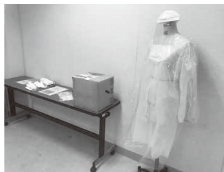
↑ 医療用防護ガウンのマネキン見本