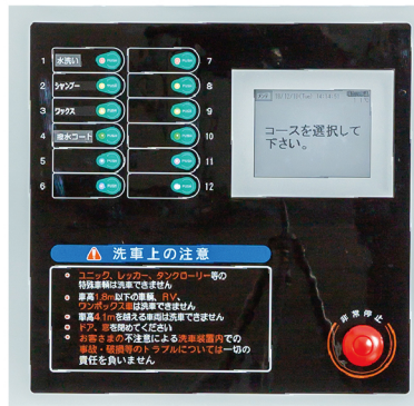
●KAIはビギナーでも簡単操作のタッチパネル方式

大型車両専用洗車機、高圧下部洗浄装置を設置することにより、ドライバーの離職率の低減、定着率の維持並びに上昇にもつながります。特に、高圧下部洗浄装置を設置することにより、車両の寿命延命にも貢献いたしますので経費削減(コストダウン)にもつながります。