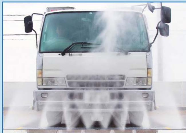
高圧下部洗浄装置 - SPJ -