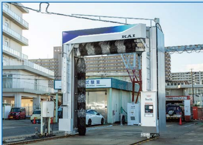
大型洗車機 - 魁 KAI -

労働環境の改善、効率化にビュウターの『最新型大型車両専用洗車機 魁-KAI-』『高圧下部洗浄装置 スパイダージェット-SPJ-』をお奨めいたします。