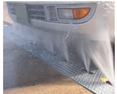
●手洗いが難しい下部をジェットで簡単洗浄

是非とも、弊社大型車両専用洗車機【魁-KAI-】、高圧下部洗浄装置の【スパイダージェット-SPJ-】導入のご検討をお願い申し上げます。