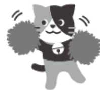
イメージキャラクター えじねこ