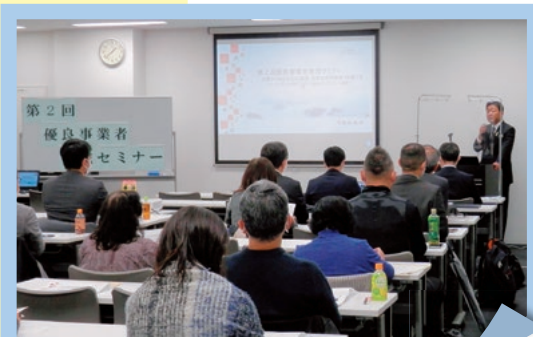
前回のセミナーの様子